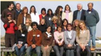
Los líderes de los diferentes proyectos de Potenciar Comunidades Rurales durante el lanzamiento del programa en Carlos Casares