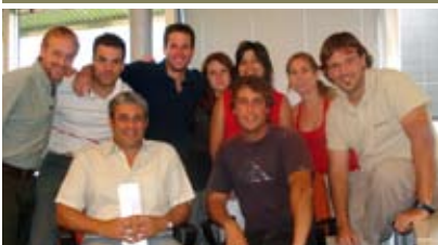
Todo el Equipo de Producción Agrícola de Los Grobo Agropecuaria en Casa Central