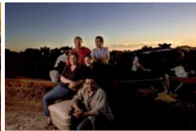
Adolfo Grobocopatel - autor de esta imagen - retrata un alto durante la cosecha en La Unión.