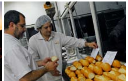
Los maestros panaderos de Molino Canepa testeando la calidad de nuestras harinas.