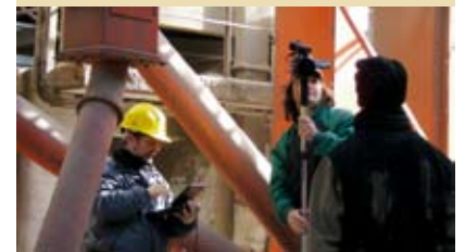
Ya comenzó la producción de los videos de seguridad en plantas de silos . Aquí, el backstage.