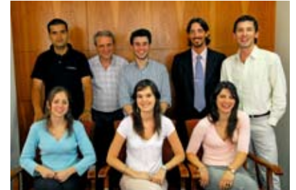
Todo el equipo de Chain Services , nuestra corredora en la Bolsa de Cereales de Buenos Aires