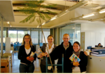
El equipo de RSE de Grupo Los Grobo organizando el sorteo del jacarandá en el marco de los festejos por el Día Mundial de la Tierra .