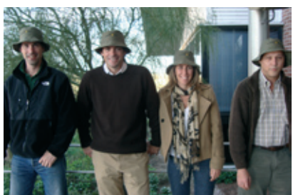
En julio pasado, recibimos la visita de Dreyfus en nuestras oficinas de Carlos Casares.