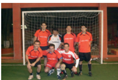
El "Dream Team" de Tierra Roja (Paraguay), antes de disputarse el torneo de fútbol amistoso contra el equipo de ABN AMRO BANK.